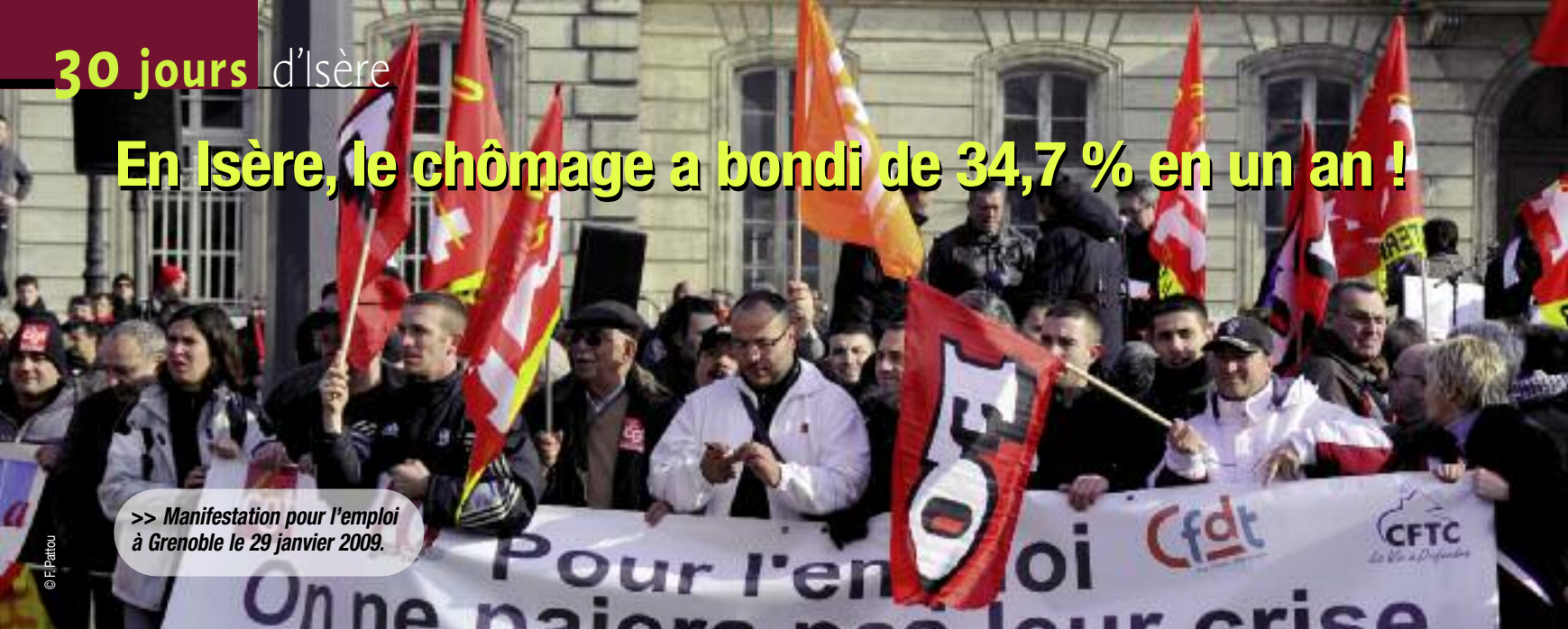
>> Manifestation pour l'emploi à Grenoble le 29 janvier 2009.