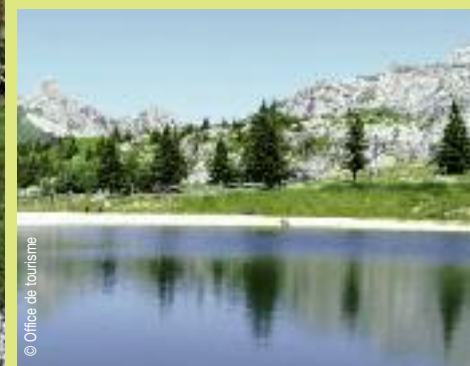
>> Le lac, au pied de la Grande Moucherolle.