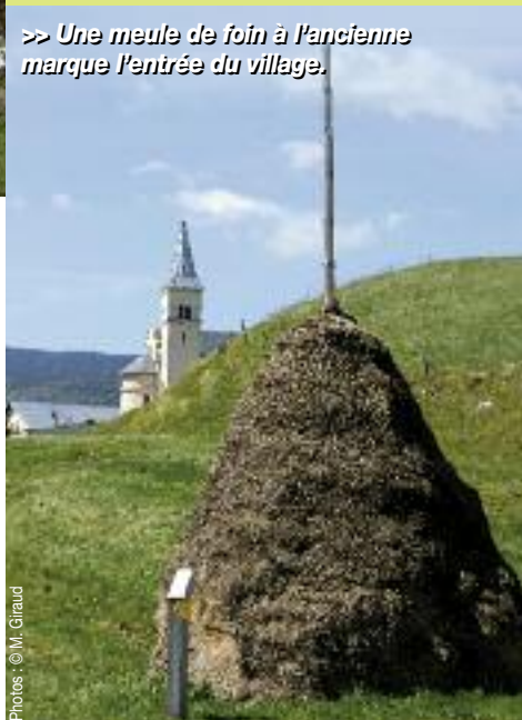
>> Une meule de foin à l'ancienne marque l'entrée du village.

Cette randonnée mythique laisse un souvenir indélébile, où s'harmonisent sentiers au cœur des combes, sommets aériens et paisible solitude. Au loin, parfois, un troupeau de brebis, deux chamois ou un bouquetin. Un vautour dans le ciel. Et le cri des marmottes. Au bivouac, est-ce la plainte d'un loup ? Il n'est peut-être pas loin. En tout cas, à Corrençon, il trône au centre même du village, de bois sculpté, hurlant en silence sur sa stèle. D'autres randonnées ramènent à Corrençon en une heure ou une demi-