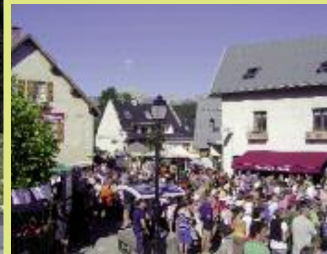
>> En période estivale, Corrençon accueille de nombreux visiteurs.