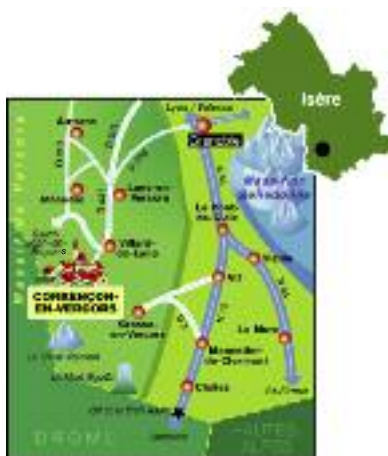
Illustration © B. Fouquet

Ici se termine la route carrossable. Arrivant à Corrençon-en-Vercors, village de 375 habitants perché à 1 100 mètres d'altitude, le visiteur a cette impression d'atteindre la dernière marche civilisée menant aux terres sauvages. L'entrée du village est marquée par deux symboles érigés de part et d'autre de la route. D'un côté, un fenier, meule de foin à l'ancienne, enroulée en hauteur autour de son bâton évoque l'importance d'une agriculture ancestrale et toujours vivante. De l'autre, un rocher dressé