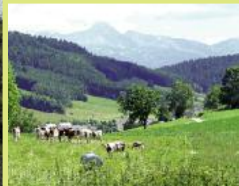
>> Une agriculture toujours vivante marque le paysage.