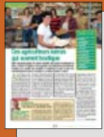
Image du mois Agenda 21 : le futur en question

Vivre mieux Ces agriculteurs qui ouvrent boutique p. 23