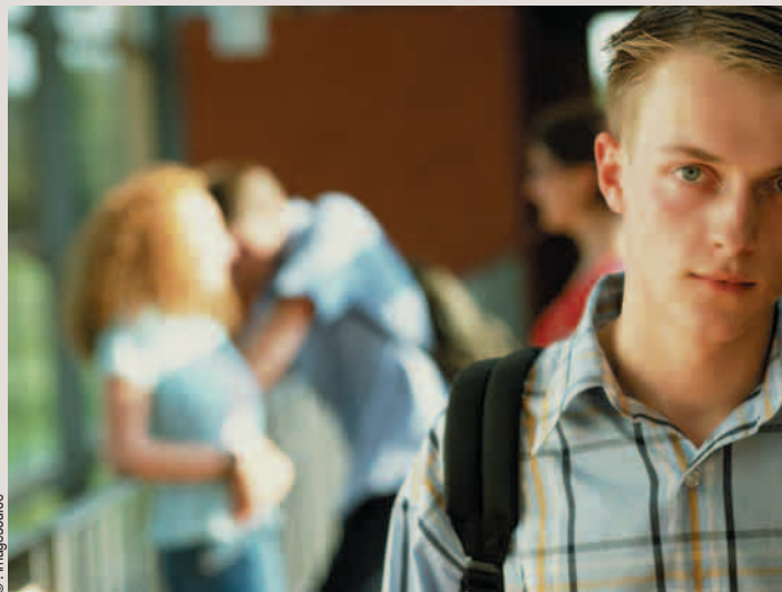
>> Le Kiosque à Fontaine permet d'accueillir une quinzaine d'enfants de 11 à 16 ans sans les couper de leur famille.