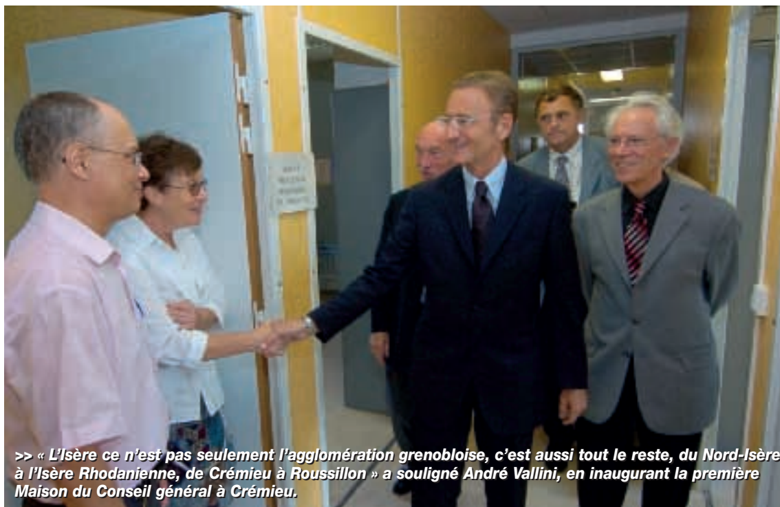
>> « L'Isère ce n'est pas seulement l'agglomération grenobloise, c'est aussi tout le reste, du Nord-Isère à l'Isère Rhodanienne, de Crémieu à Roussillon » a souligné André Vallini, en inaugurant la première Maison du Conseil général à Crémieu.

■ Social, routes, collèges, économie, tourisme, agriculture : le Conseil général de l'Isère de par ses compétences est un acteur majeur de la vie en Isère. Il dispose pour 2006 d'un budget de 1,2 milliard d'euros mis en priorité au service de la solidarité et de la qualité de vie des d'Isérois.