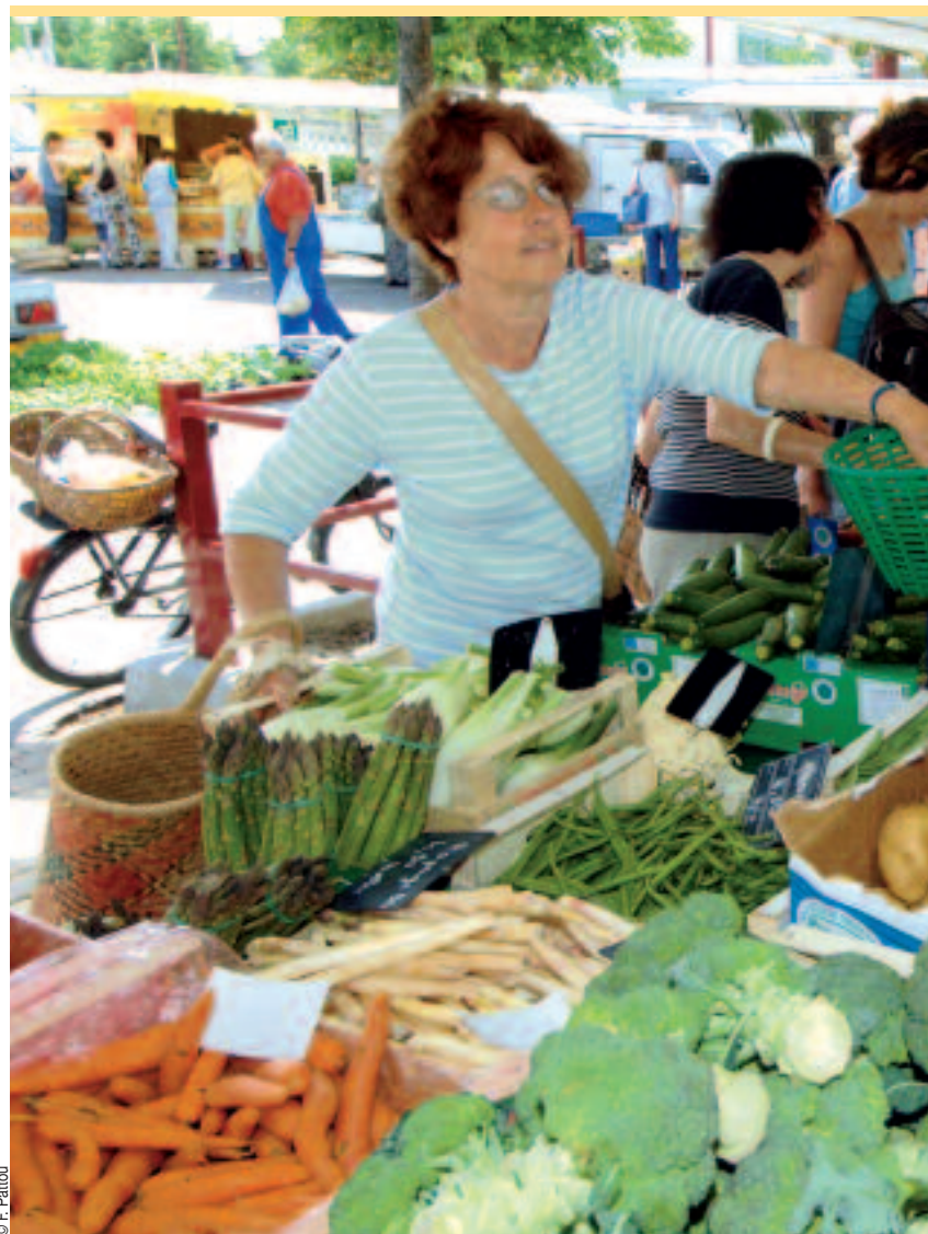
» Les consommateurs sont de plus en plus nombreux à manger « bio », la santé étant de plus en plus associée à l'alimentation : ici au marché de Meylan.

Première motivation des consommateurs : rester en bonne santé. « Les campagnes nationales font de plus en plus le lien entre santé et alimentation », remarque Antoine, fidèle client du marché de Bourgoin-Jallieu. Les dangers des pesticides commencent aussi à être connus du public. « Une étude de l'Université de Bordeaux, publiée en 2005, a révélé qu'il y avait trois fois plus de cancers du sang chez les enfants de viticulteurs, une des