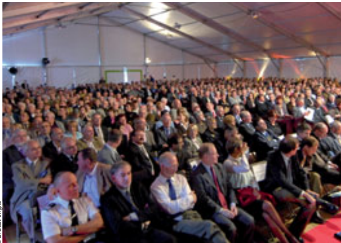
>> 900 élus communaux étaient présents à Allevard-les-Bains le 14 octobre dernier.

« Quel avenir pour la commune ? » : c'était le thème du 49 e Congrès des maires de l'Isère, organisé le 14 octobre dernier à Allevard-les-Bains par l'Association des maires de l'Isère (AMI) présidée par Daniel Vitte. Plus de 900 élus, maires, adjoints, présidents de