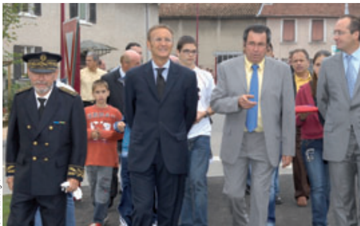
» André Vallini a inauguré récemment plusieurs équipements financés grâce au soutien du Conseil général, au Pin, à Saint-André-en-Royans et à Saint-Didier-de-la-Tour (photo).

Partenaire économique, social et culturel des communes de l'Isère, le Conseil général consacrera cette année 63 millions d'euros pour leur permettre de mener à terme leurs projets de développement. Ce montant est supérieur de 8 % par rapport aux 58,7 millions d'euros attribués en 2005 et de 23 % par rapport aux 51,4 millions d'euros attribués en 2004. Cette enveloppe importante trouve sa traduction dans une foultitude d'aménagements. Le